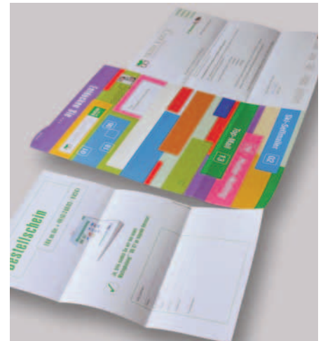
Das Poster-Mail lässt sich als Poster (398 x 292 mm) aufklappen. Im Büro der Zielgruppe platziert, bietet es eine starke Werbewirkung.