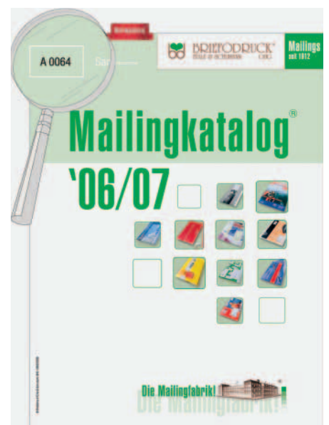
Der Mailingkatalog zielt auf mittelständische Unternehmen. Die Sammelstücknummer ist eine Besonderheit der zweiten Edition.